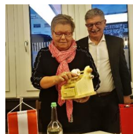
Text und Fotos: H.U. Mani, Österreicher-Verein Oberwallis