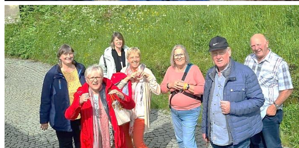
Text und Fotos: Monika Löscher, Österreicher-Verein Thun